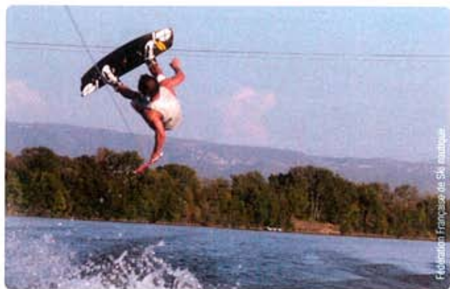
Fédération Française de Ski Nautique